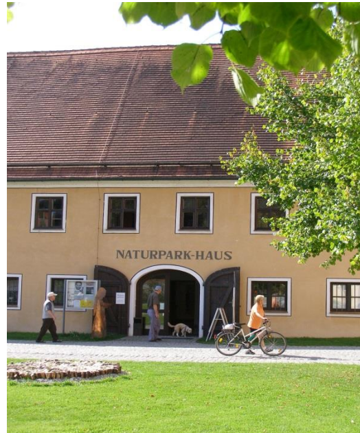
Naturpark-Haus in Oberschönenfeld